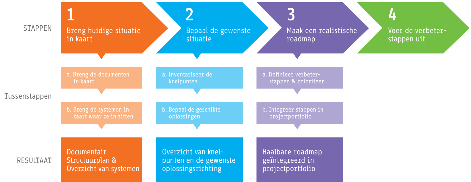
Figuur 3. Overzicht van de te nemen stappen om te komen tot een documentstrategie.