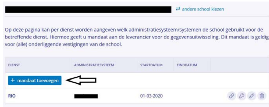
Figuur 1. Mandaat toevoegen