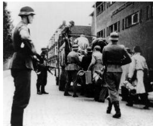
Een van de vele razzia's in Amsterdam

Op 11 februari 1941 zijn er gewelddadige confrontaties tussen joden en de WA. Daarbij wordt een WA-man gedood. Dit is de aanleiding voor de eerste razzia: in de Amsterdamse jodenbuurt, op het Jonas Daniël Meijerplein, worden op 22 en 23 februari 425 jonge joden door de Duitsers met grof geweld bijeengedreven en vervolgens weggevoerd. Later blijkt dat ze naar een kamp gebracht zijn.