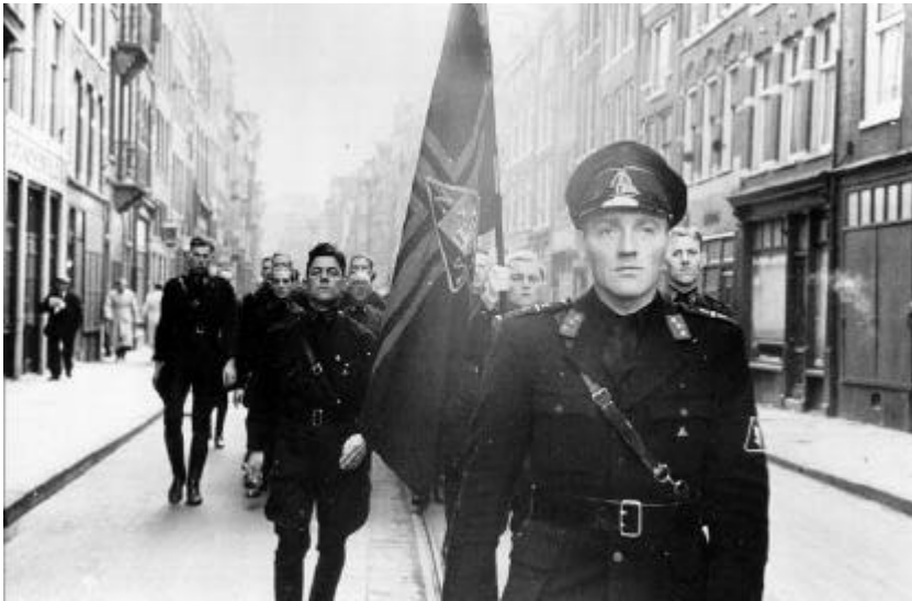
Een demonstratie van de WA in Amsterdam

Ze lokken vechtpartijen en opstootjes uit. Dat gebeurt vooral in de grote steden en met name in Amsterdam. De Nederlandse bevolking wil niet veel met ze te maken hebben. De WA-mannen krijgen wel steun van Duitse soldaten.