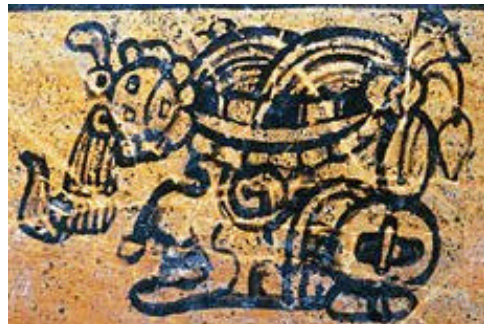
Maya hiërogliefen op een vaas

Ook brengen kolonisten het christendom mee. In hun ogen zijn indianen heidenen die naar de verdoemenis gaan als ze het christelijke geloof niet aannemen. Ook zouden ze wreed zijn, omdat ze hun woongebied met hand en tand verdedigen tegen de kolonisten of omdat ze mensenoffers brengen aan hun goden. Er gaan dan ook missionarissen naar de nieuwe gebieden om de indianen te bekeren. Soms gaat dat vreedzaam, maar vaak worden indianen gedwongen tot bekering. Soms worden indianen die zich niet willen laten dopen omgebracht. Kolonisten en geestelijken gaan nog een stap verder als blijkt dat een nieuw-ontdekt volk, de Maya's, een eigen (hiërogliefen-)schrift heeft en eigen literatuur. Geestelijken laten dan boeken van de indianen verbranden omdat er "heidense" teksten in staan. Zo is er van de literatuur van de Maya's bijna niets bewaard gebleven. Door de zendingsdrang van kolonisten verspreidt de christelijke godsdienst zich snel maar gaat ook veel cultureel erfgoed (= de 'erfenis' van een volk: literatuur, godsdienst, gebouwen enz.) verloren.