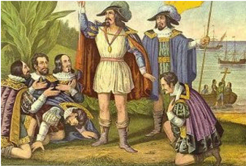
Het oude beeld van de landing van Columbus in 1492, waarbij Columbus nog als held wordt afgeschilderd.

Columbusdag wordt ook in Spanje en Italië gevierd. In Spanje heet het de Dia (= Dag) de la Hispanidad . In Latijns-Amerikaanse landen als Chili, Mexico en Venezuela wordt deze dag herdacht onder de naam Dia de la Raza (Dag van het Ras of de Dag van de Mensheid). Dan staat men stil bij de Spaanse culturele erfenis van Amerika. In Costa Rica heet de dag de Dia de las Culturas . Dan wordt stilgestaan bij de waarde van alle culturen die in dit land vertegenwoordigd zijn, de indiaanse culturen, de Europese cultuur, de cultuur van afstammelingen van negerslaven en de culturen van Aziaten. In deze landen wordt de dag altijd herdacht op de dag van de ontdekking in 1492, op 12 oktober dus.