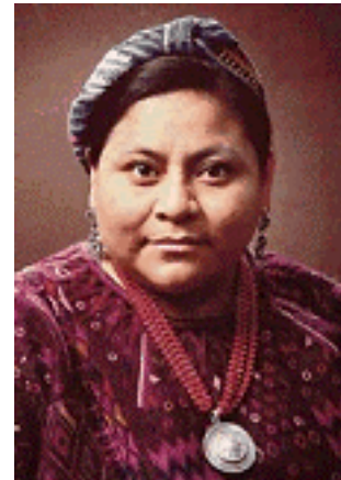
Rigoberta Menchu Tum

Indianen komen echter voor hun rechten op. Ze eisen een eigen stukje land om te bewerken, respect voor hun cultuur en democratische rechten. In 1992 krijgen ze een steun in de rug als de Guatemalteekse mensenrechtenactiviste Rigoberta Menchu Tum de Nobelprijs voor de Vrede krijgt. Hun acties hebben soms succes. In Guatemala bijvoorbeeld treedt in 1996 een grondwet in werking waarin staat dat de indianen daar, net als iedereen, grondrechten hebben en dat die moeten worden beschermd. Een nieuwe mijlpaal wordt bereikt als in 2001 Toledo gekozen wordt tot president van Peru. Hij wordt dan 's werelds eerste staatshoofd van indiaanse afkomst.