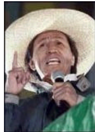
Toledo, de eerste Indiaanse president ooit