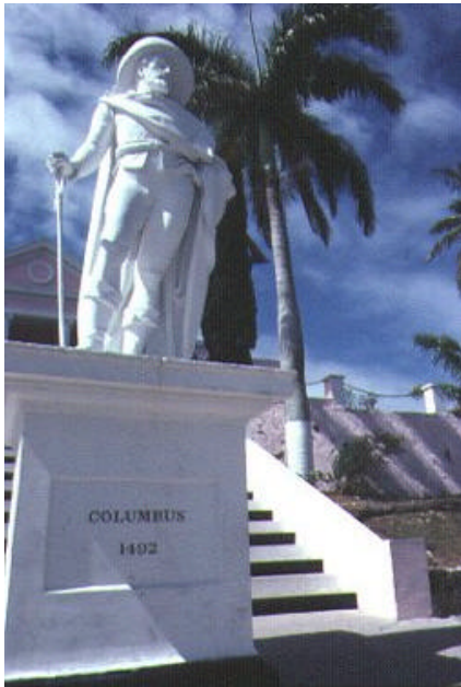
Standbeeld van Columbus in Philadelphia

In de Verenigde Staten wordt de ontdekking van Amerika herdacht op Columbus Day. Voor het eerst gebeurt dat in 1792 in New York. In 1876 verrijst er in Philadelphia een monument voor Columbus. In 1893 wordt er in Chicago een tentoonstelling gehouden ter ere van Columbus. Die is voor een deel betaald door het Congres, het Amerikaanse parlement. Daarna roepen steeds meer staten Columbus Day uit tot een feestdag in de staat en in 1934 bepaalt president Franklin D. Roosevelt dat Columbus Day een nationale feestdag wordt. Vanaf 1971 heeft iedereen vrij op Columbus Day en wordt de dag op de tweede maandag van oktober gevierd.