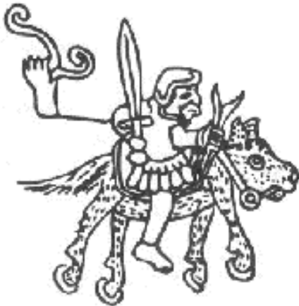
Spaanse krijger te paard, getekend door de Azteken

Overal waar kolonisten komen raken indianen hun land, hun vrijheid of allebei kwijt. Ze worden verjaagd uit hun woongebieden. Daartoe houden kolonisten bloedige veldtochten waarbij hun dorpen worden verbrand en hun bezittingen, vooral goud en andere kostbaarheden, worden geroofd. Zij die de rooftochten overleven, vluchten naar gebieden waar nog geen kolonisten zijn en leven daar in primitieve omstandigheden. Of ze worden gedwongen als slaven te werken op plantages die in hun woongebied worden aangelegd. Weer anderen worden weggevoerd om in goud- en zilvermijnen te werken. Met hun moderne wapentuig, kanonnen en vooral handvuurwapens onderwerpen Spaanse kolonisten de reeds genoemde rijken. Door oorlog en rooftochten komen vele duizenden indianen om het leven.