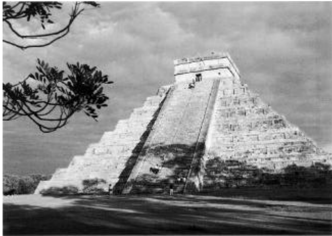
Maya-piramide in Chichén Itzá

In de nieuw-ontdekt gebieden bestaan er echter al hoogstaande beschavingen. Zo treffen kolonisten drie machtige rijken aan, die van de Maya's in Guatemala, de Azteken in Mexico en de Inca's in Peru. Deze volken zijn kundige bouwers die weinig onderdoen voor de piramiden-bouwers in het Egypte van de farao's. En in Peru, Chili en Bolivia hebben de Inca's en andere indianenvolken irrigatiesystemen gebouwd die nog steeds werken.