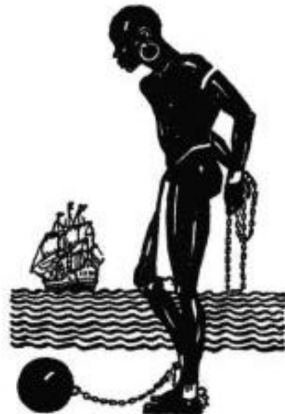
Bekende afbeelding van een slaaf met op de achtergrond de Sancta Maria, het schip van Columbus

Begin jaren '90 van de 20 e eeuw verandert het beeld van Columbus sterk, juist als de VS de 500 e verjaardag van de ontdekking van Amerika wil vieren. Mensen die van (gemengd) indiaanse of Afrikaanse afkomst zijn, gaan dan hun eigen verhaal vertellen over wat er tijdens en na de reizen van Columbus is gebeurd in Amerika. Ze beschouwen Columbus als een slavenhater, moordenaar en zelfs als een oorlogsmisdadiger. Ook zouden kolonisten uit Europa enorme schade aan het milieu hebben veroorzaakt; oerwouden zijn verdwenen, bizonen en andere dieren uitgestorven. Deze opvattingen krijgen steeds meer aanhang. Daardoor vieren steeds meer Amerikaanse scholen Columbus Day op een andere manier. De heldenverering hoort niet, wordt er dan gezegd. In plaats daarvan wordt de Dag van de Etnische Diversiteit gevierd. Andere mensen vieren de Dag van de Inheemse Volken of Native Americans Day . Zeg maar: de Dag van de Indianen. Dat gebeurt bijvoorbeeld in South Dakota.