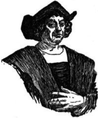
Een van de vele portretten van Christoffel Columbus

Christoffel Columbus wordt in 1451 in de Italiaanse stad Genua geboren. Zijn eigenlijke naam is Cristophoro Colombo. Zijn vader is een wolwever en hij wil dat Columbus later óók wolwever wordt. Maar Columbus wil als matroos op zee varen. Als hij 21 jaar is geworden gaat hij als matroos werken voor een handelshuis dat schepen gebruikt om handelswaar te vervoeren. Hij reist naar havensteden in Spanje en Portugal.