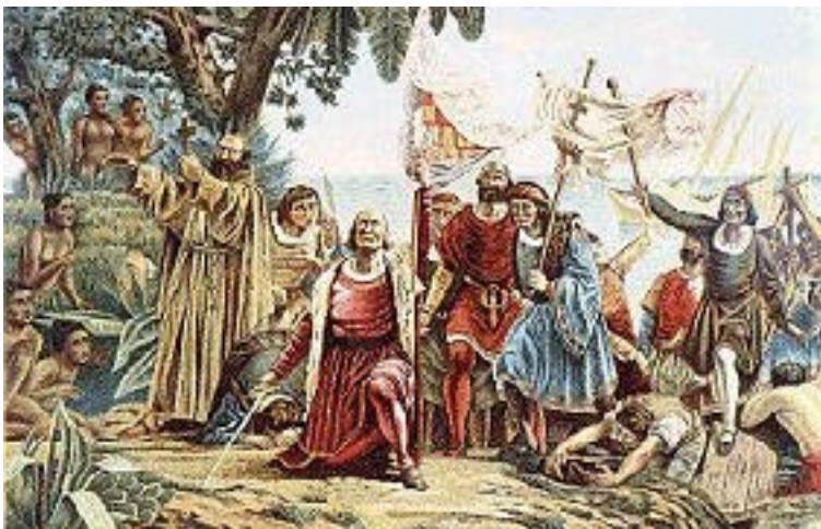
Columbus zet voet op het land van de Taino's

Op 12 oktober zien bemanningsleden vogels in de lucht, dus moet er land in de buurt zijn. Inderdaad ziet een matroos op de Pinta, Rodrigo de Triana, land. Het blijkt een eiland te zijn, bewoond door een onbekend volk. Columbus noemt dit volk de Taino's. Hij en enkele bemanningsleden gaan aan land om daar naar goud te zoeken.