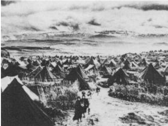
Een vluchtelingenkamp in Libanon, winter 1948

Tijdens de oorlog van 1948 vluchten meer dan 700.000 Palestijnen naar de Gaza-strook, de Westelijke Jordaanoever of de omliggende Arabische landen.