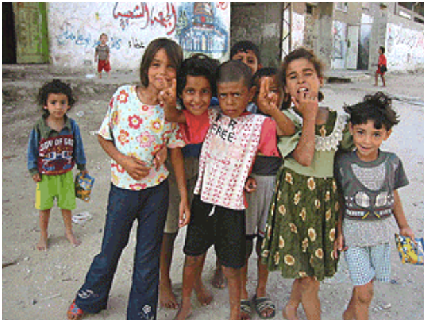
Kinderen van een basisschool in het kamp