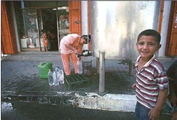
Waterflessen vullen uit een grote tank

Waarschijnlijker is de verklaring van een VN-diplomaat: hij zegt dat Israël niet genoeg elektriciteit beschikbaar stelt. Bovendien zou de hoeveelheid vaak worden verminderd omdat de Palestijnse overheid de rekeningen niet op tijd betaalt. Ook is het elektriciteitsnet verouderd en vaak kapot.