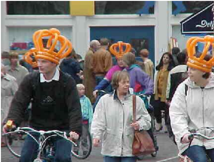
Iedereen kan zich op 30 april koning of koningin voelen. Zelfs op de fiets.

Ook de naam van ons Koningshuis 'het huis van Oranje' is afkomstig van een streek in het land. Niet in ons land, maar in Frankrijk. Daar ligt het prinsdom Oranje. Als in 1533 in het Duitse stadje Nassau het jongetje Willem wordt geboren op Slot Dillenburg, erft hij dat stuk van Frankrijk van zijn neef. Hij erft ook een aantal stukken van Nederland. Willem mag zich Prins van Oranje noemen en al gauw staat hij bekend als Willem van Oranje.