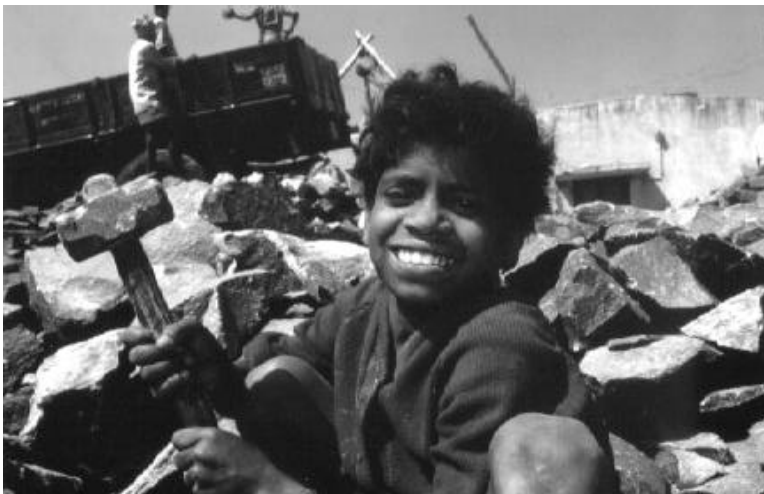
In een steengroeve

In sommige landen waar kinderarbeid voorkomt, doet de regering daar weinig of niets tegen omdat die het niet nodig vindt. Het komt zelfs voor dat de regering beweert dat er géén kinderarbeid voorkomt, terwijl dat wel het geval is. Verder gaan kinderen werken omdat er geen goede of helemaal geen school is waar ze naar toe kunnen gaan, of omdat hun ouders kunnen het schoolgeld niet kunnen of willen betalen. Hierdoor kunnen ze later alleen slecht betaalde banen vinden. Krijgen ze dan zélf kinderen, dan moeten die ook gaan werken om bij te springen.