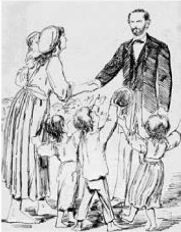
De kinderen van Nederland bedanken van Houten

Na drie jaar is het onderzoek klaar. De commissie laat weten dat er inderdaad veel kinderen aan het werk zijn. Ook heeft ze vastgesteld dat fabriekskinderen soms niet goed worden behandeld. Maar ze zegt ook dat het geen zin heeft om kinderarbeid te verbieden. Ouders zouden hun kinderen die in fabrieken werken dan thuis of op staat aan het werk zetten. Ze kunnen het geld dat hun kinderen verdienen, niet missen.