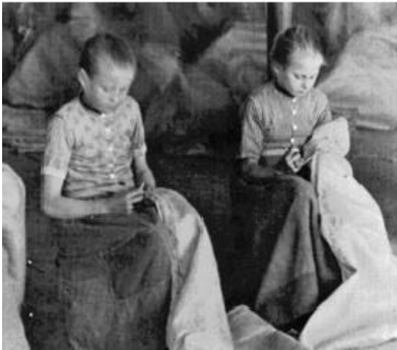
Meisjes in een naaiatelier

In werkplaatsen worden meubels, kleding en andere artikelen gemaakt die je iedere dag nodig hebt. Dit heet huisindustrie.