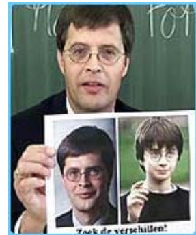
Premier Balkenende tijdens het interview met het Jeugdjournaal

Op 1 april 2003 bracht het Jeugdjournaal het bericht naar buiten dat premier Balkenende, van wie gezegd wordt dat hij zoveel op Harry Potter lijkt, in de volgende film over Harry Potter, 'De gevangene van Azkaban', de vader van Harry Potter zou spelen. Balkenende speelde het spelletje mee en liet zich voor de camera interviewen.